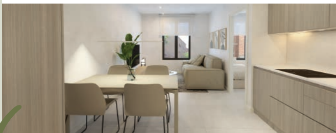
Nou Casal de la Dona amb recursos per al benestar de les dones, servei de canguratge i espai compartit de treball