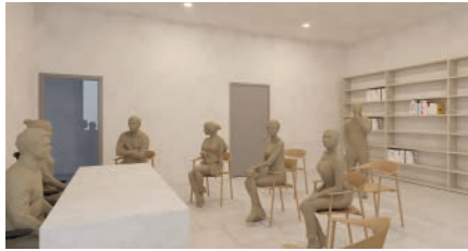
Espais per a entitats i aules formatives