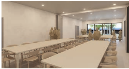
Sala d'actes i espai per la gent gran