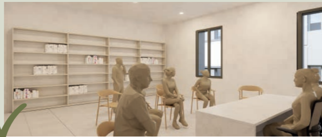
Espai disponible per a entitats, activitats veïnals i sala d'actes