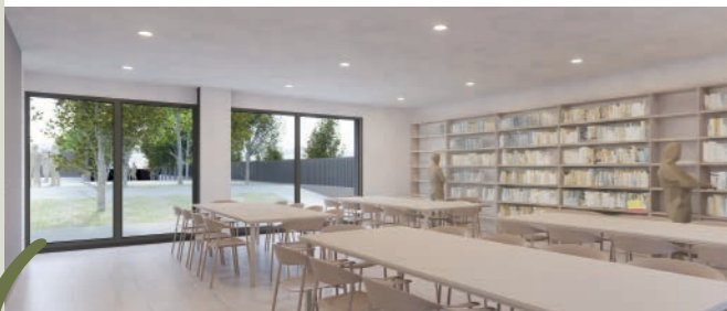
Sala d'estudi oberta les 24 hores i espais formatius per a joves