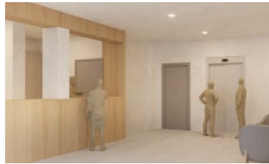
Casal de la Dona