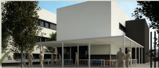
Espais exteriors oberts al barri, amb pista poliesportiva i cobertes