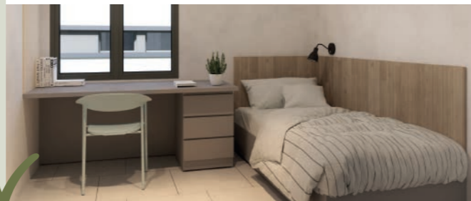
Servei residencial d'inclusió amb acompanyament professional