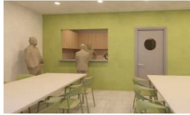
Servei residencial d'inclusió