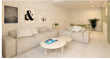
Apartaments per a dones