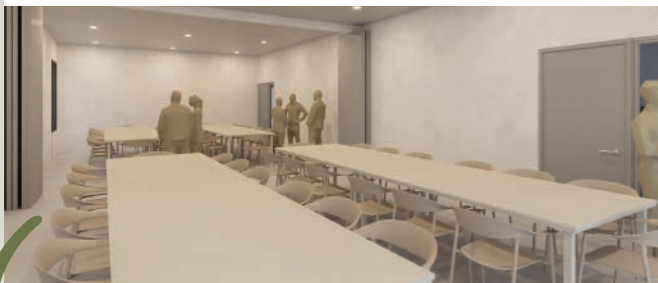
Espai per a les persones grans i menjador sènior