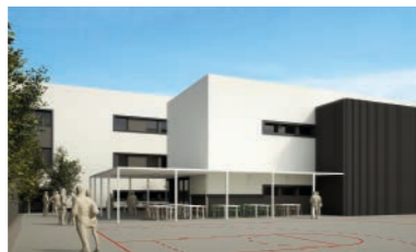
Espais exteriors, plaça pública i zona poliesportiva